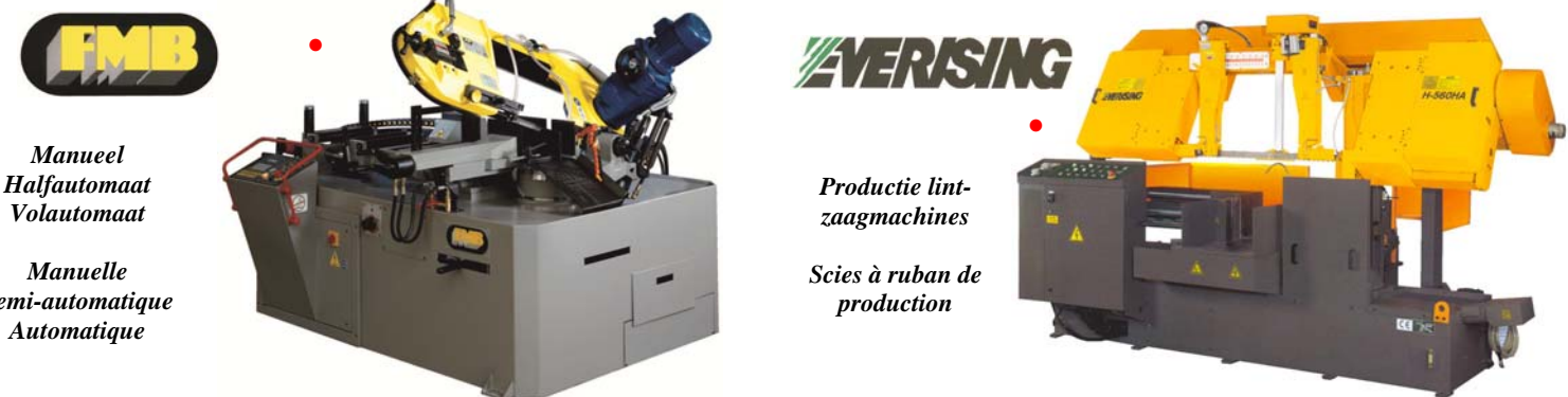
Manueel Halfautomaat Volautomaat