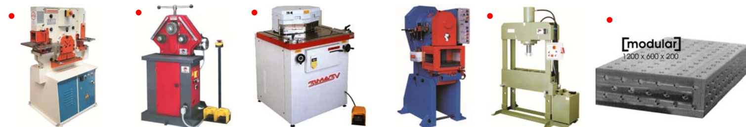
Pons- knipmachines Combinées