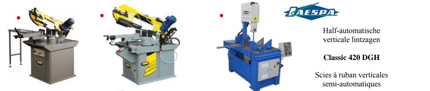
Half-automatische verticale lintzagen