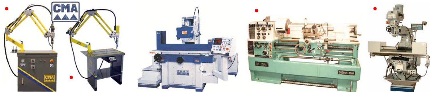
Pneum., elektr. en hydraulische taparmen Bras de taraudage pneum., electr. et hydr.