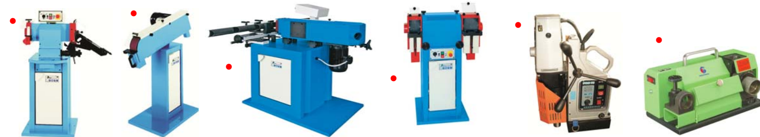
Gamma slijp-, pijpslijp en borstelmachines Gamme de ponçuses, grugeoirs de tubes et polisseuses