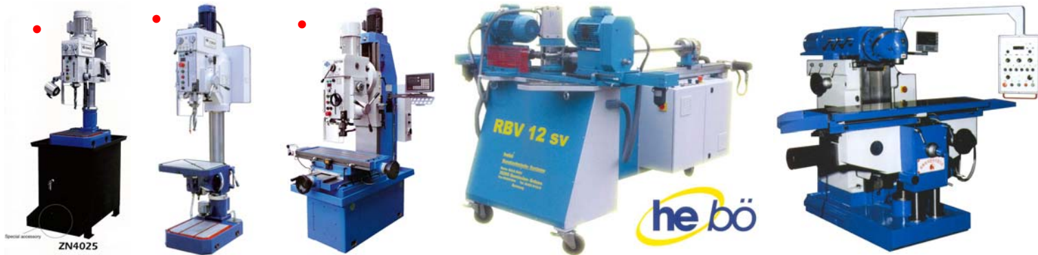
Uitgebreid gamma boor- en boorfreesmachines Gamme de foreuses et fraiseuses