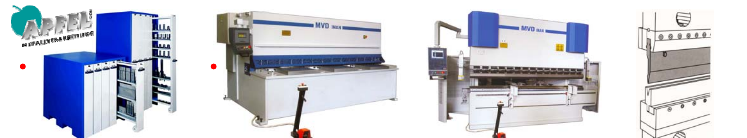
Gereedschapskasten Armoires d'outillage